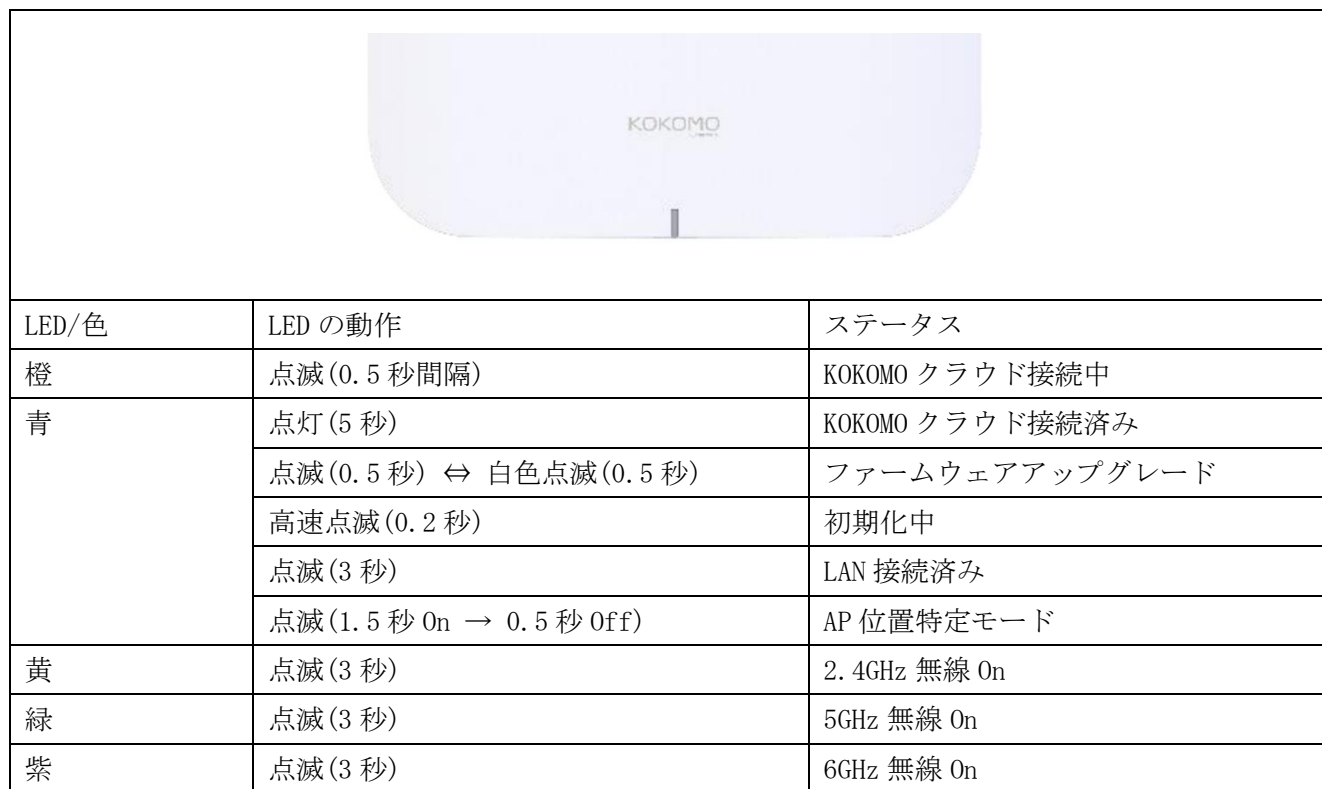
表 6-1 LED 表示内容